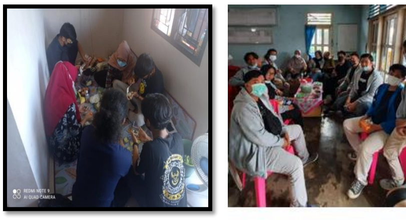
Gambar 1. Pendampingan Terhadap UMKM Kelurahan Tanah Patah

Pelaksanaan pengabdian ini dilakukan bersama mahasiswa kepada masyarakat dalam upaya pemanfaatan daun remunggai menjadi bahan tambahan untuk makanan dan meningkatkan keterampilan dalam pengolahan tanaman remunggai menjadi brownies bernilai ekonomi bersama Masyarakat UMKM Kelurahan Tanah Patah dapat dilihat pada gambar berikut: